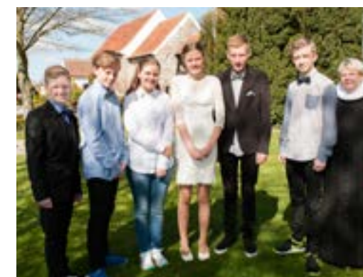
Sæby den 2. maj 2015