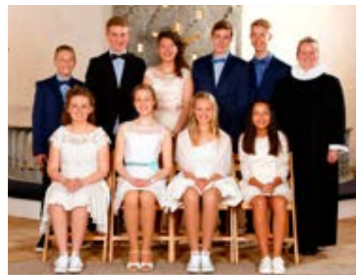
Selde den 1. maj 2015