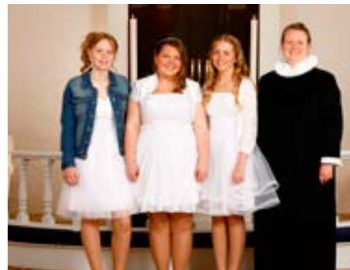
Junget den 3. maj 2015