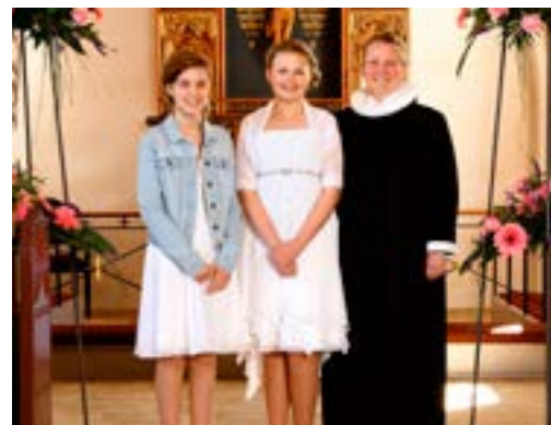
Åsted den 2. maj 2015