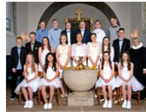
Glyngøre den 3. maj 2015